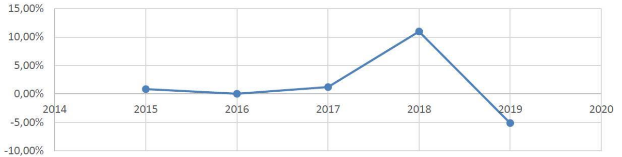
Prisudvikling Basis IT

Udviklingen i efterspørgslen på support til brugere og enheder: